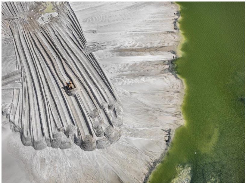
© Edward Burtynsky, Estanque de relaves de fósforo #4, cerca de Lakeland, Florida, EE.UU., 2012. Cortesía de Flowers Gallery, Londres / Nicholas Metivier Gallery, Toronto

La World Photography Organisation se complace en anunciar que el famoso fotógrafo canadiense Edward Burtynsky obtuvo el premio Outstanding Contribution to Photography ( Contribución destacada a la fotografía ) de los premios Sony World Photography Awards 2022. Ampliamente reconocido como uno de los fotógrafos contemporáneos más prestigiosos del mundo, Burtynsky es conocido por sus amplias imágenes de paisajes industriales y la crisis ambiental general.